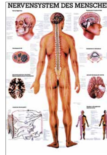
NERVENSYSTEM NERVOUS SYSTEM ZENUWSTELSEL SYSTÈME NERVEUX