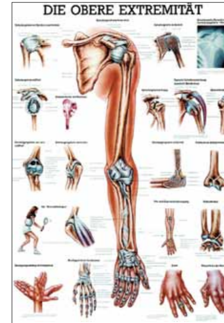
OBERE EXTREMITÄT UPPER LIMB BOVENSTE LEDEMATEN EXTRÉMITÉ SUPÉRIEURE