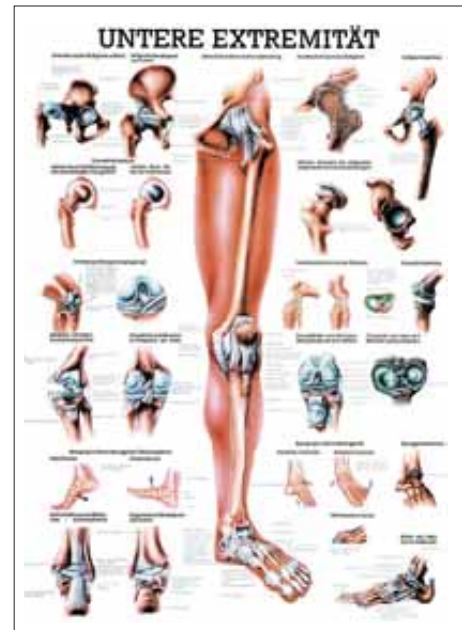
2. Untere Extremität Chart 'Lower Limb Onderste ledemaat Extrémité inférieure