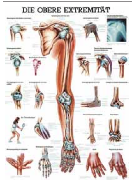
1. Obere Extremität Upper Limb Bovenste ledemaat Extrémité supérieure

LEHRTAFELN - CHARTS - DIDACTISCHE POSTERS - PLANCHES D'ENSEIGNEMENT