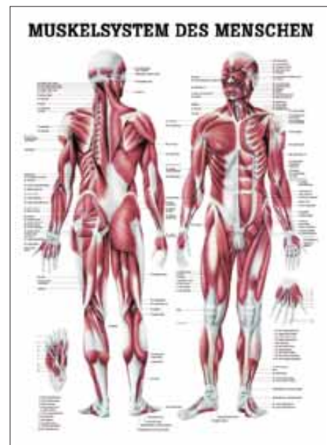
4. Muskulatur Muscular System Spierstelsel Musculature