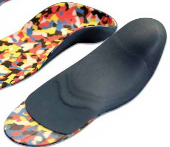
Langsohlig Full sole Langzilig Semelle entière kids 75P11240