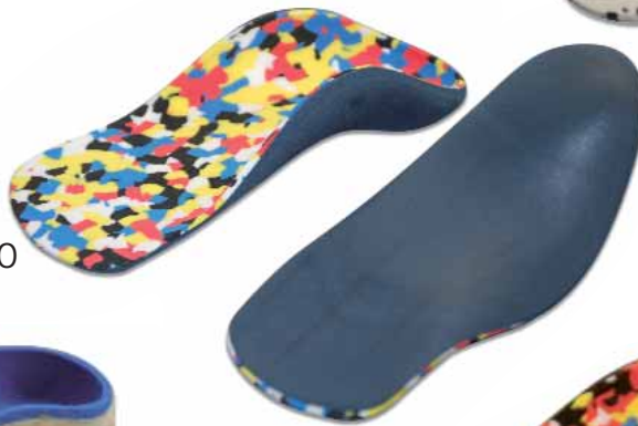
Kurzsohlig Half sole Halfzool Semelle courte kids 75P13240