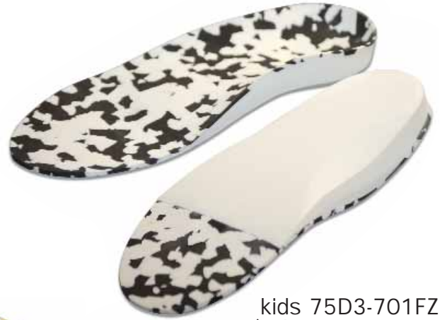
kids 75D3-701FZ (kids 75D3-701NZ)