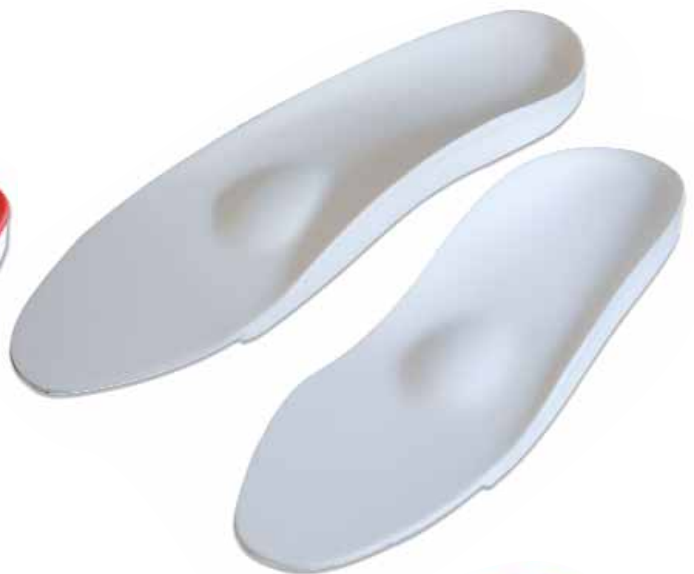
sport non perfo 75ED1001