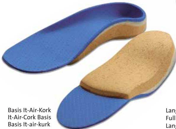
Basis It-Air-Kork It-Air-Cork Basis Basis It-air-kurk Base Liège It-air kids 75P11245