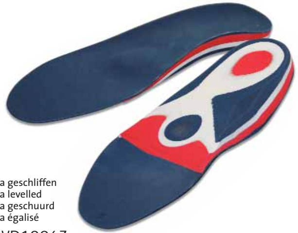
Varia geschliffen Varia levelled Varia geschuurd Varia égalisé 75VD1006Z