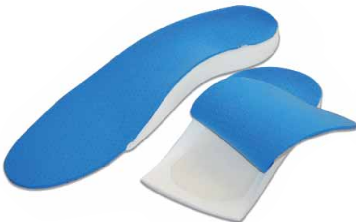
sport perfo open 75FA3002