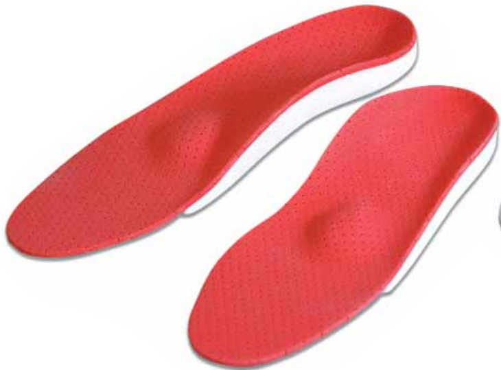
sport perfo 75FD1011