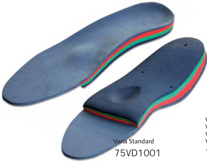
Varia Standard 75VD1001

Beispiele - exemples - voorbeelden - exemples