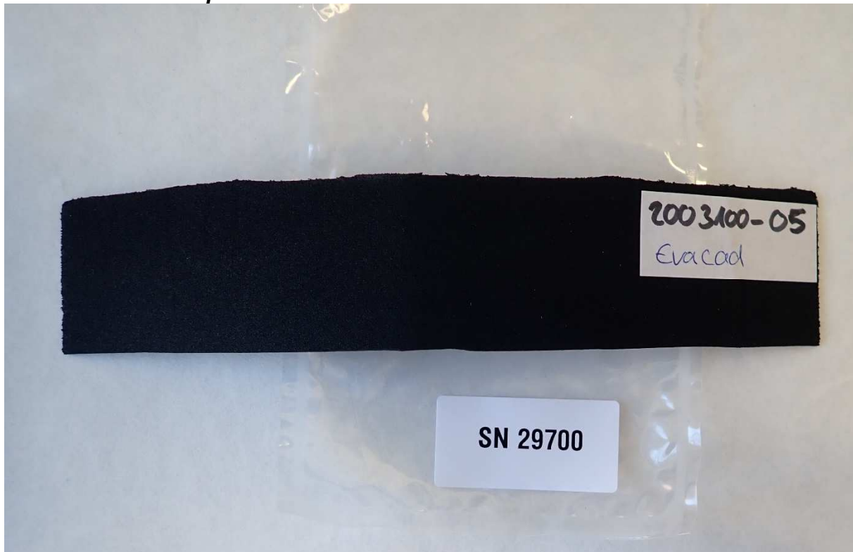
Abbildung 2 / Figure 2: Material Evacad