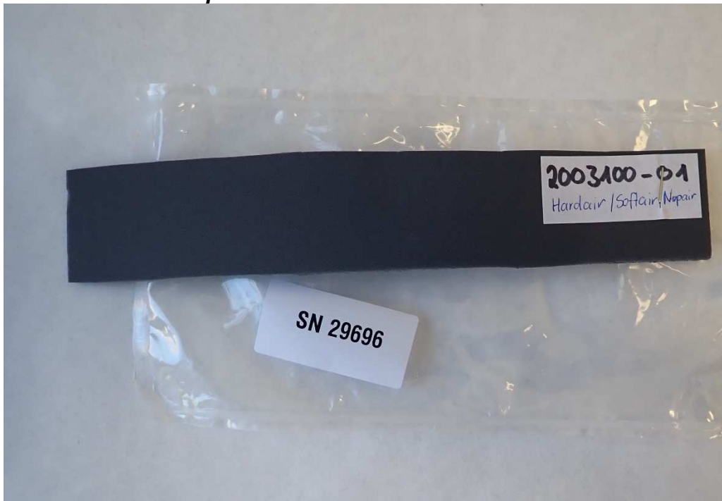
Abbildung 2 / Figure 2: Material Hardair/Softair/Nopair