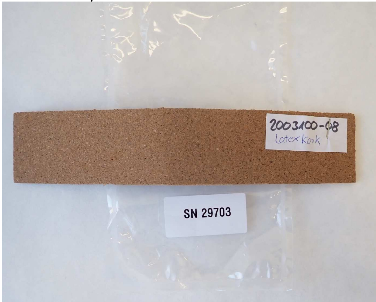
Abbildung 2 / Figure 2: Material Latexkork